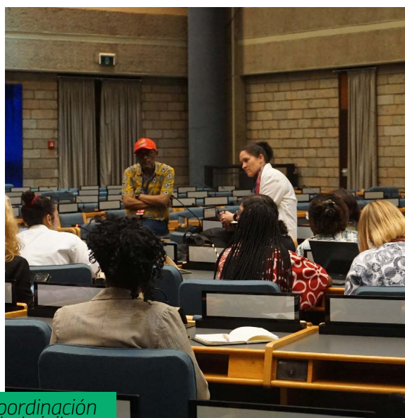
Reuniones de coordinación de la sociedad civil